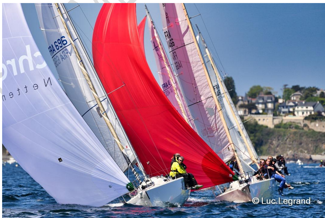
Figure 1 : Grand prix de Saint-Cast J80 (SNBSM)

Les manifestations nautiques et sportives peuvent être organisées par différents types d'organismes publics ou privés selon les cas, ce sont le plus souvent les fédérations ou associations sportives de la discipline concernée, les centres nautiques, mais également les collectivités territoriales. (Agence des aires marines protégées, 2009)